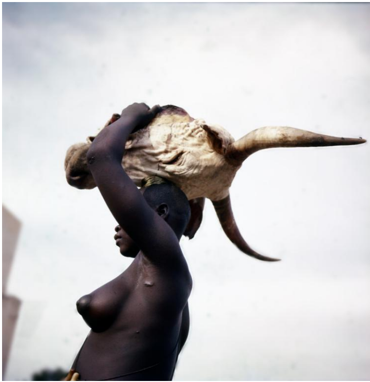
© MAX-POL FOUCHET : TCHAD, c. 1958-59 Femme portant une tête de vache. Épreuve d'après Ektachrome 6 x 6, réf. IMEC / FCH 301