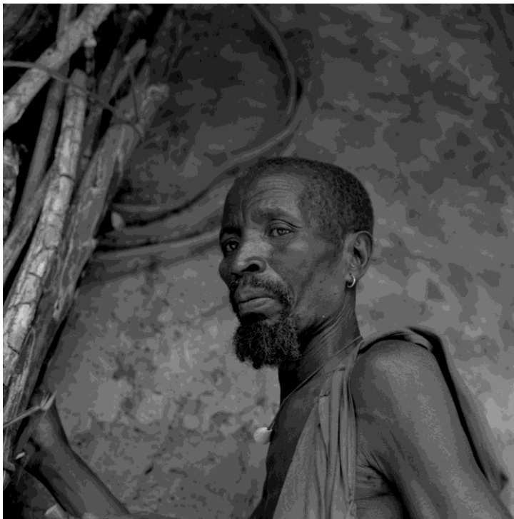
© MAX-POL FOUCHET : SÉNÉGAL, Casamance, c. 1960-65 Homme du Pays Diolo. Épreuve d'après négatif noir et blanc 6 x 6, réf. IMEC / FCH 304