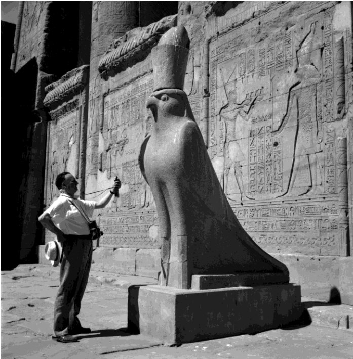
© MAX-POL FOUCHET : ÉGYPTE, Edfou, c. 1960-61

Max-Pol Fouchet posant près de la statue d'Horus