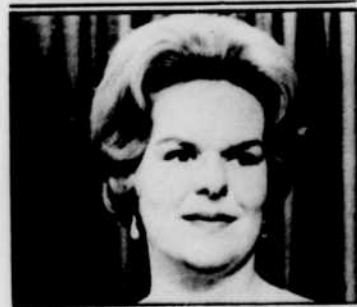
Maureen FORRESTER sera entendue à «Montréal-Inter», à 9 h 00.