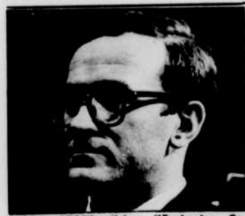
Robert CRAFT dirige l'Orchestre Columbia, aux «Chefs-d'oeuvre», à 16 h 30.