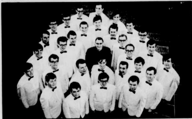
Chorale de l'université de Moncton

Ballades et chansons , c'est un moment de détente, dans une ambiance amicale. Un peu comme si, durant les 13 émissions, on se donnait la main, de l'est à l'ouest du pays.