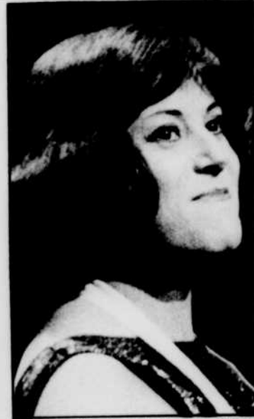
Un texte d'Eugène Cloutier sur Colette RENARD, sera lu à «D'une certaine manière».