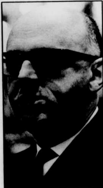
M. Jean DRAPEAU, maire de Montréal, sera invité à «Revoir Terre des Hommes», à 18 h 00.